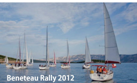
Beneteau Rally 2012